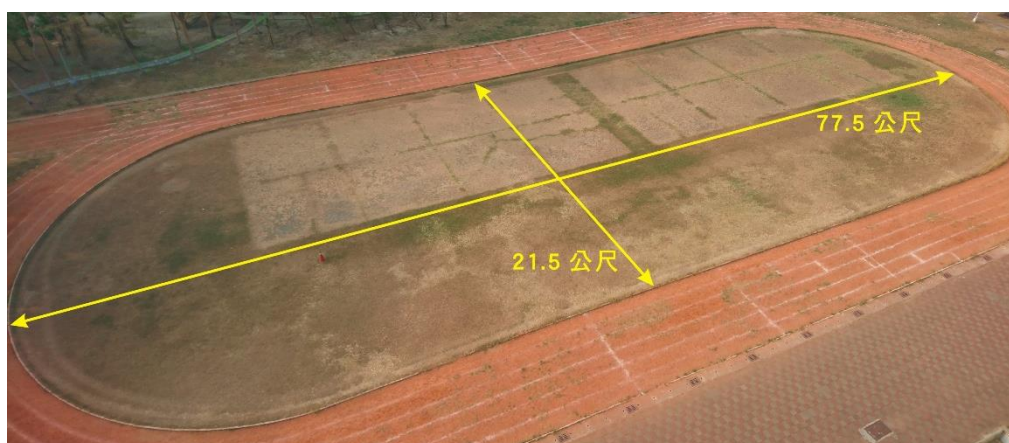
圖一 飛行競賽場地大小示意圖